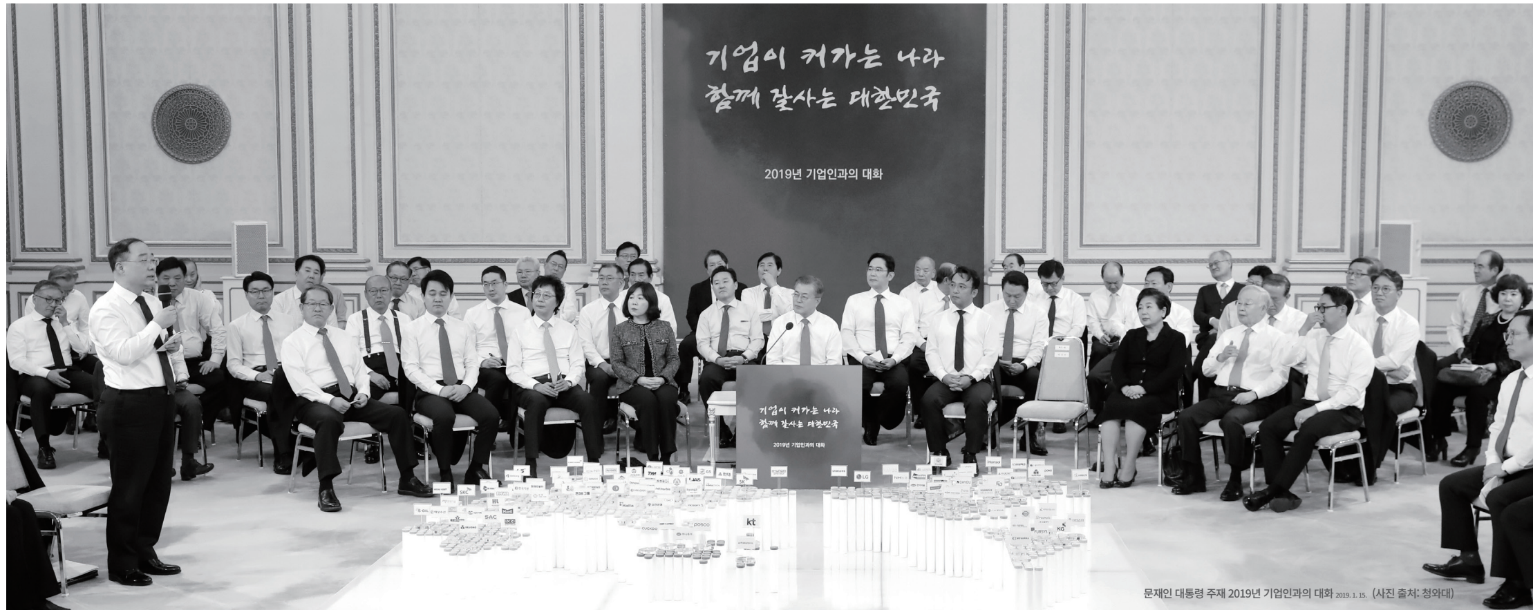
문재인 대통령 주재 2019년 기업인과의 대화 2019.1.15.